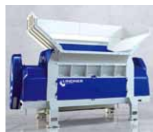
1次破碎 ジュピター

1次破碎、2次破碎、ワンステップ用の機種を取り揃えています。お客様の用途に合わせた最適な機種をご提案いたします。