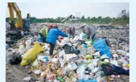
炎天下の悪臭漂う環境の中、資源物(プラスチック)を手で回収