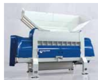
ワンステップ ポラリス