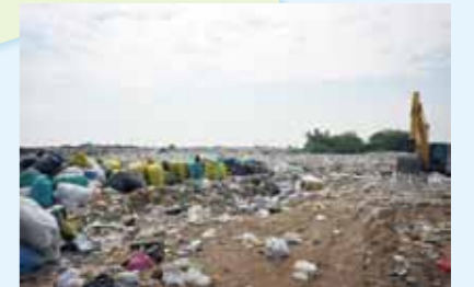
広大な処分場に運ばれてきた大量のゴミ

現状では対応しきれないとは思えないこの廃棄物問題の行く末を地球規模で考える必要があるのではないのでしょうか。